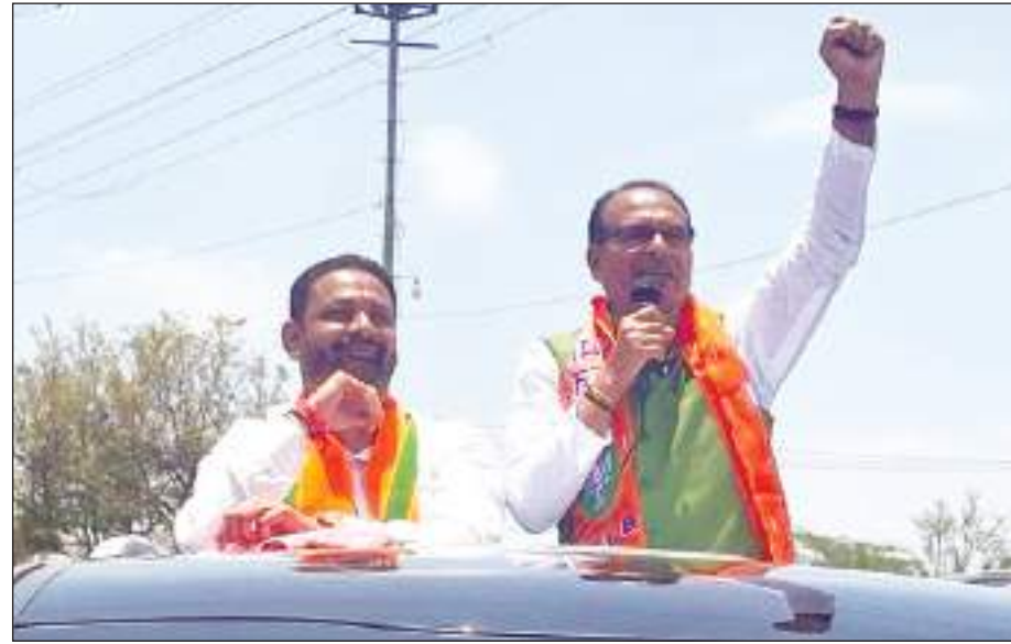
मध्य प्रदेश के सीएम शिवराज सिंह चौहान कर्नाटक में चुनाव प्रचार करते हुए।

तंज कसा स्वास्थ्य सेवाओं पर पूछेंगे तो यह तमंचा बोलेंगे, इनसे पूछेंगे कि वादा किया था कि पढ़ाई सस्ती होगी तो बोलेंगे तमंचा। पाए तो तमंचा। महंगाई, बेरोजगारी की बात करो तो कहेंगे तमंचा। सपा अध्यक्ष ने कहा कि हमारी बनाई साइकिल ट्रेक बर्बाद कर दी। महंगाई पर भाजपा नहीं बोलती है। सिलेंडर से लेकर दाल तक महंगी हो गई। महंगाई, बेरोजगारी चरम सीमा पर पहुंच गई है। किस निजी स्कूल की फीस कम हो गई। सड़कों से सांड नहीं हटा पा रहे हैं। शहरों को कोई सुविधाएं नहीं मिल पा रही है। उन्होंने कहा कि लखनऊ जैसी राजधानी से समाजवादियों का काम हटा दो तो क्या मिलेगा वहां? भाजपा वाले बताएं यहां पर एक अटो वाले को पुलिस ने पीट-पीटकर मार दिया था, क्या उसकी सरकार ने सहायता की?