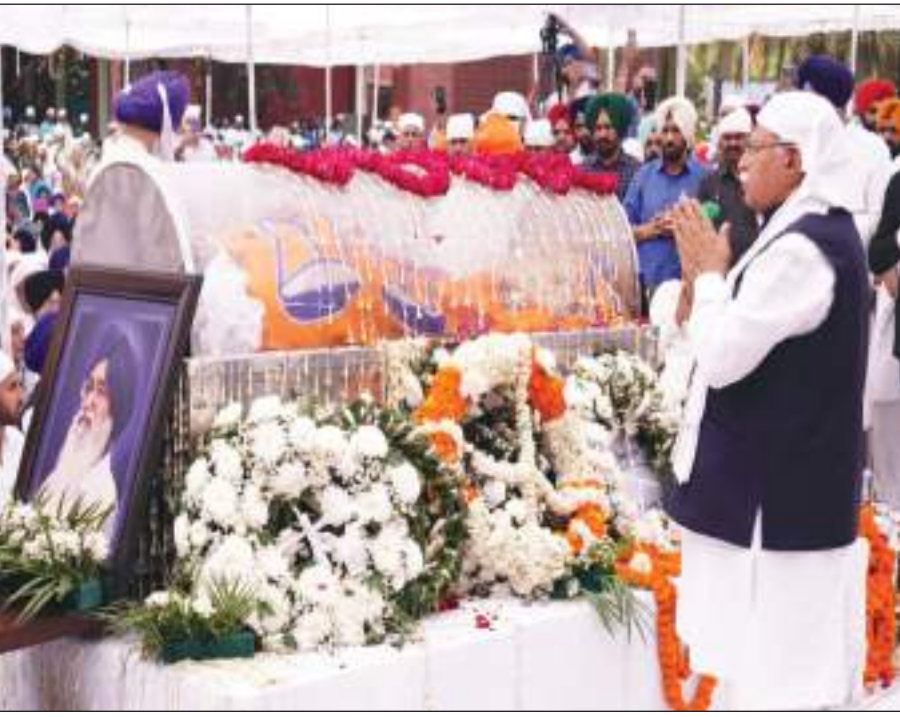
हरियाणा के मुख्यमंत्री मनोहर लाल पंजाब के पूर्व मुख्यमंत्री स्वर्गीय सरदार प्रकाश सिंह बादल के पार्थिव शरीर पर पुष्प अर्पित कर श्रद्धांजलि देते हुए।