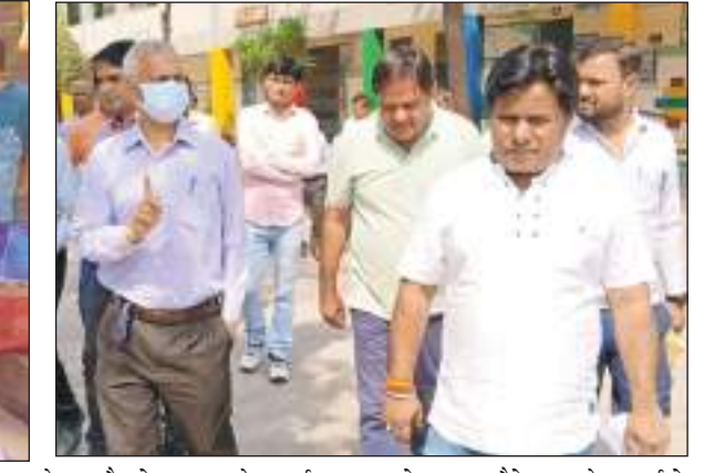
परेशान है तो वह हमारे कार्यालय पर संपर्क कर सकता है। उसकी समस्या का उचित समाधान किया

जो भी समस्याएं थीं वह डीसी साहब को दिखाई गईं। उन्होंने आगे बताया कि अगर क्षेत्र का कोई भी व्यक्ति