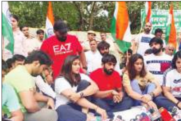
कोई ऐसा आदेश पास नहीं करते। ये एक मामला है, जिसमें पीड़ित नाबालिग थी है। आपको जो भी कहना है, 28 अप्रैल को सुनवाई के दौरान अपनी बात रखें। याचिकाकर्ता महिला पहलवानों की ओर से कपिल सिब्बल ने कहा कि हम भी नया हलफनामा

जिरह = एक नाबालिग समेत सात पहलवानों ने 21 अप्रैल को कनाट प्लेस थाने में बृजभूषण के खिलाफ शिकायत दर्ज कराई थी दायर करेंगे। इस मामले पर 25 अप्रैल को कोर्ट ने दिल्ली पुलिस को नोटिस जारी किया था। सात खिलाड़ियों ने याचिका दायर कर बृजभूषण शरण सिंह के खिलाफ एफआईआर दर्ज करने की मांग की है। केंद्र सरकार ने भारतीय कुश्ती संघ के कामकाज को देखने के लिए पांच सदस्यीय कमेटी का गठन किया है। मुकदमा मेरीकॉम उस कमेटी का नेतृत्व कर रही है जो पहलवानों के आरोपों की जांच के लिए गठित की गई है। जनवरी में विनेश फोगाट और बजरंग पुनिया समेत कई पहलवानों और कोचों ने बृजभूषण सिंह के आरोप लगाते हुए दिल्ली के जंतर-मंतर पर धरना प्रदर्शन दिया था। इसके बाद केंद्रीय युवा और खेल मंत्रालय ने आरोपों की जांच के लिए कमेटी का गठन किया था। एक नाबालिग समेत सात पहलवानों ने 21 अप्रैल को कनाट प्लेस थाने में बृजभूषण शरण सिंह के खिलाफ शिकायत दर्ज कराई थी। हाल ही में ये पहलवान फिर से जंतर-मंतर पर धरने पर बैठ गए।