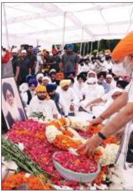
प्रधानमंत्री मोदी पंजाब के पूर्व सीएम प्रकाश सिंह बादल को पुष्पांजलि अर्पित करते हुए।