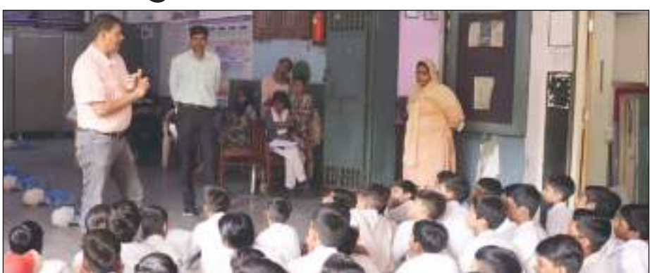
टीम एक्शन इंडिया/नई दिल्ली उत्तर-पूर्वी दिल्ली के गोकलपुरी विधान सभा स्थित गोकलपुरी में प्रतिष्ठा युवा संगठन द्वारा पदमश्री डॉ के.के. अग्रवाल की संस्था हार्ट केयर

फाउंडेशन के माध्यम से सीपीआर प्रशिक्षण कार्यक्रम आयोजित किया गया। जिसमें सहयोग कम्प्यूनिटी वेलफेयर अंगिनोइजेसन एवं राजकीय वरिष्ठ माध्यमिक बाल विद्यालय डी