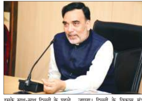
इसके साथ-साथ दिल्ली के पहले पशु चिकित्सा कॉलेज के निर्माण कार्य में भी तेजी लाने के निर्देश जारी किए गए हैं। पशु चिकित्सा कॉलेज का निर्माण दिल्ली के सतबरी में 56 एकड़ में किया